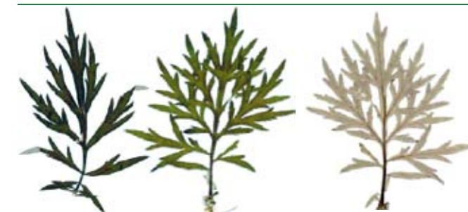
Gemeiner Beifuß: Oberseite grün, Unterseite silbrig