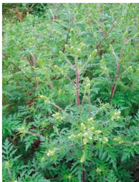
Beginnende Blüte (ab Mitte Juli)