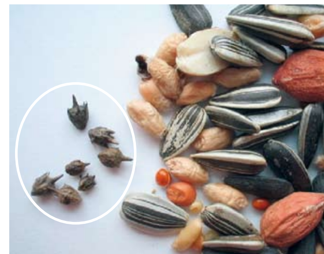
Ambrosia-Samen im Vogelfutter

Nach bisherigen Erkenntnissen wird Ambrosia überwiegend mit landwirtschaftlichen Produkten wie z.B. Vogelfutter nach Deutschland eingeschleppt. Mit Vogelfutter gelangt die Art häufig in Gärten oder auf Felder wie z.B. auf Schnittblumenfelder, von wo aus sie sich weiter ausbreiten kann. Häufig werden Ambrosia-Samen mit Erdmaterial oder anhaftend an Bau- und Landmaschinen bzw. PKW an neue Standorte verschleppt.