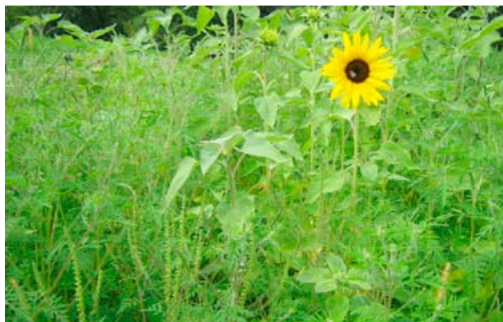
Ambrosia in Sonnenblumenfeld

Ambrosia-Vorkommen in der freien Landschaft sind von besonderer Bedeutung, weil sich die Art dort unbemerkt ausbreiten und große Bestände bilden kann.