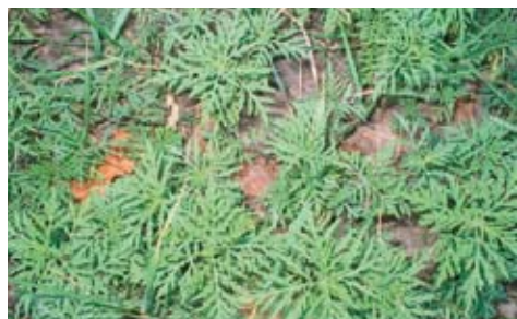
Ambrosia-Jungpflanzen (im Juni)