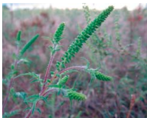
Vollblüte (August bis Oktober)