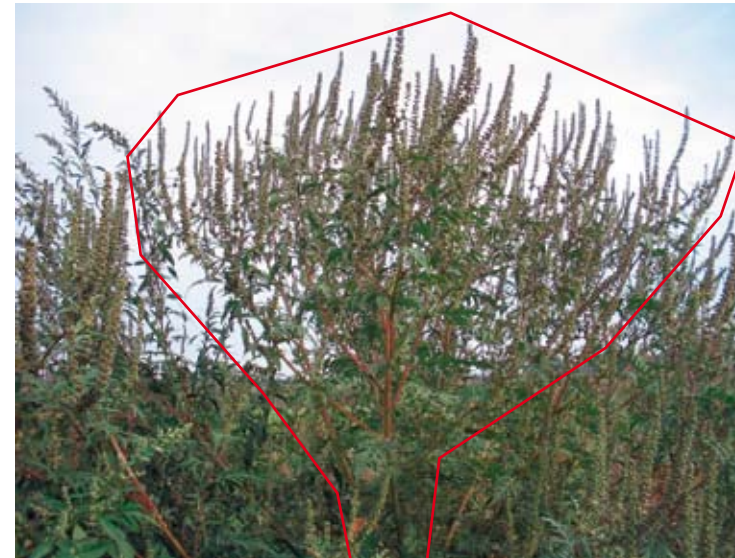
Typische breit ausladende, kerzenleuchterartige Wuchsform der Beifuß-Ambrosie bei freiem Stand (siehe Seite 2)

Sie Informationsmaterial und Broschüren, Auskunft zu aktuellen Themen und Internetquellen sowie Hinweise zu Behörden, zuständigen Stellen und Ansprechpartnern bei der Bayerischen Staatsregierung.