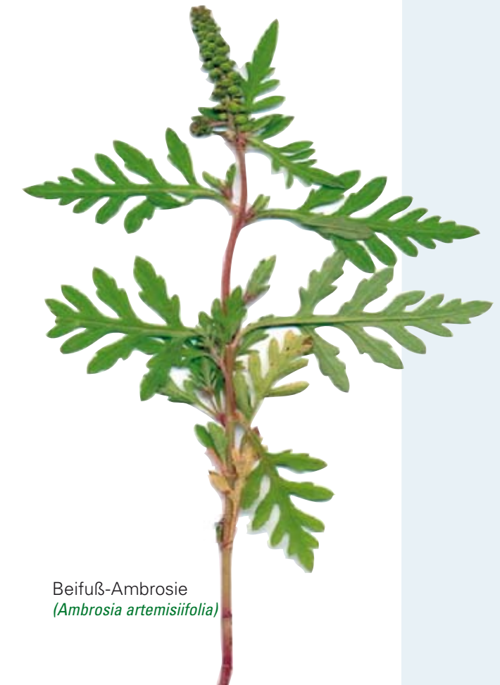
Beifuß-Ambrosie ( Ambrosia artemisiifolia )