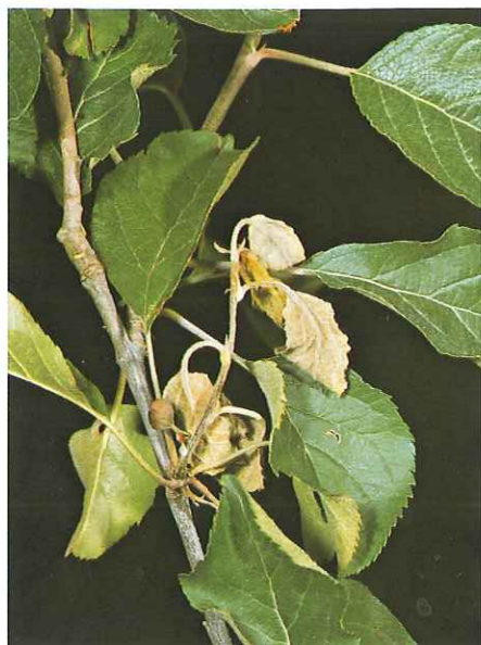
2) Befallener Apfeltrieb

Typische Merkmale der Feuerbrandkrankheit sind die meist dunkelbraun bis schwarz gefärbten Stiele der abgestorbenen Blüten und Blätter an den erkrankten Zweigen (siehe Abb. 2, 3 und 4) und die oft auffallend dunkel gefärbten Hauptadern in den Blättern. Die abgestorbenen, eingetrockneten Blätter und Früchte bleiben an den Bäumen hängen. Die erkrankten zunächst fahlgrün aussehenden jungen Triebspitzen krümmen sich oft infolge Wassermangels krückstockartig. Bei spätblühenden Gehölzen und Nachblütern (z. B. an Birnen und Äpfeln) besteht auch im Sommer hohe Infektionsgefahr. Triebspitzen können ebenfalls während der ganzen Vegetationsperiode infiziert werden.