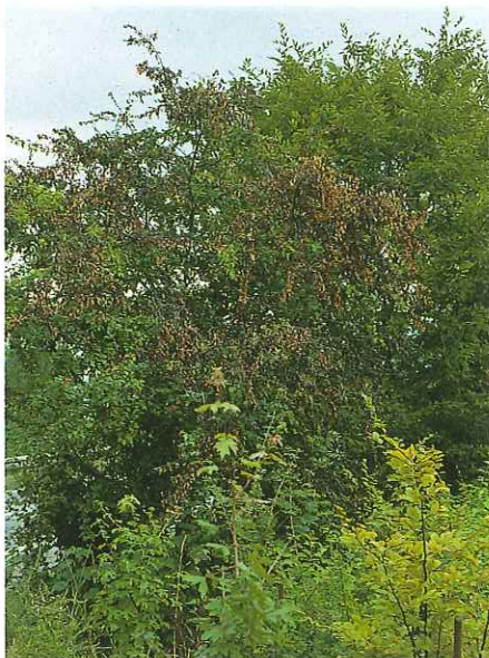
9) Stark befallener Weißdorn

Bei Rodungen von Kernobstbäumen in ausgewiesenen Landschafts- und Naturschutzgebieten ist ein eventuell bestehendes Nachpflanzgebot mit geeigneten Obstbäumen zu beachten.