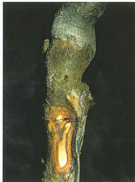
5) Befallene Unterlage

Bei einem Befall der Unterlagen kommt es infolge von Versorgungsstörungen im Spätsommer oft zu einem frühzeitigen rötlichen Verfärben der Blätter beziehungsweise zu einer vorzeitigen Ausfärbung der Früchte. Dieses Symptom kann aber auch die Folge eines Befalls durch pilzliche Erreger an den Unterlagen und der Stammbasis sein.