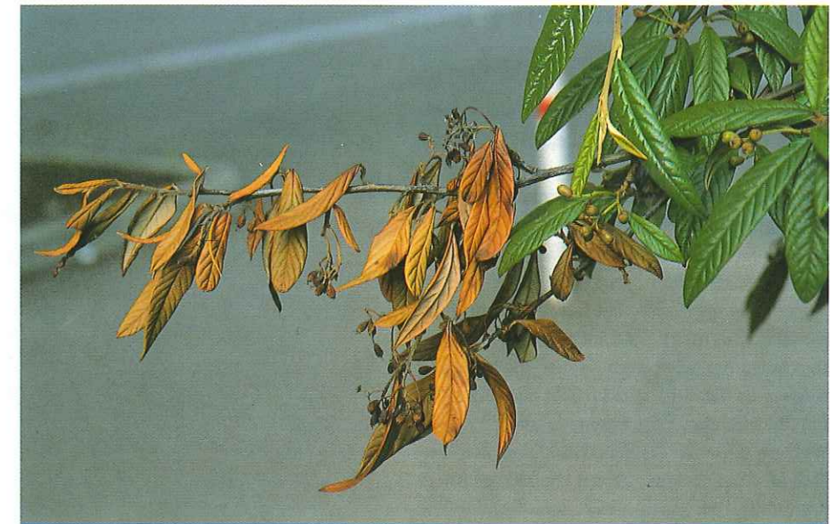
7) Befall an Cotoneaster salicifolius