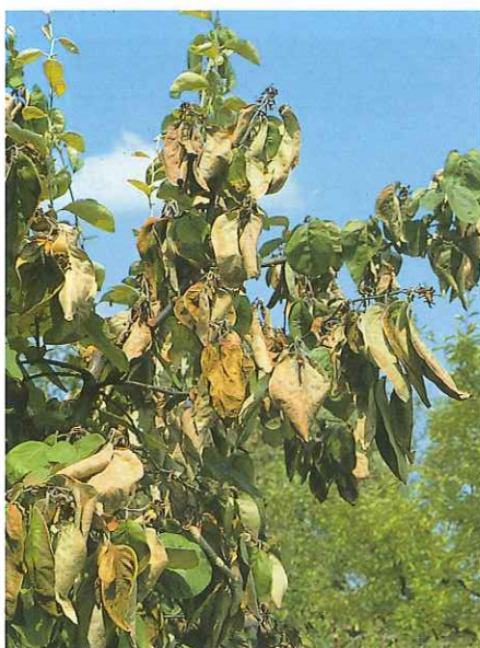
10) Befallener Quittenzweig

In Baumschulvermehrungsquartieren und Muttergärten (=Reiserschnittgärten) können auch Kupfer-Präparate (Verträglichkeit beachten) mit einem gewissen Erfolg eingesetzt werden.