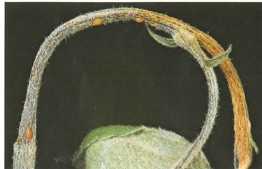
6) Bakterien Schleimtropfen; hier an Apfel

Die Bakterien überdauern die Vegetationsruhe in erkrankten Rindenteilen. Von hier erfolgt im Frühjahr und Sommer die Verbreitung mittels Regentropfen (durch Abwaschen usw.), Wind sowie