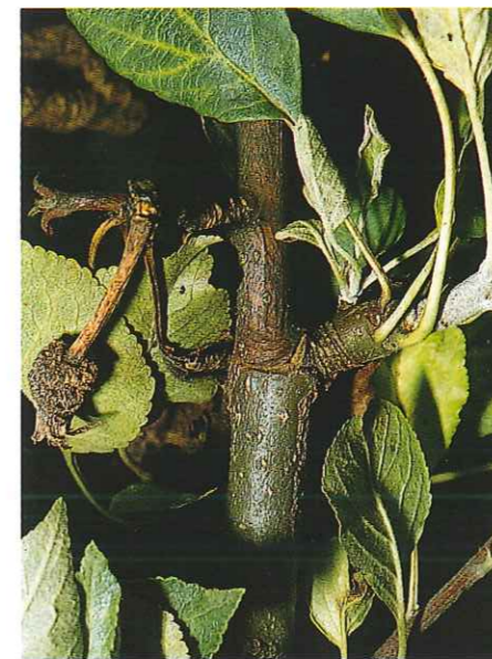
8) Von Monilia sp. befallener Kurztrieb

saugenden und blütenbesuchenden Insekten, wie beispielsweise Bienen, Blattläuse, Blattsauger, Wespen, Hummeln, Fliegen und Ameisen. Auch Vögel sollen bei der Verbreitung eine Rolle spielen. Die Krankheit beginnt meist mit Blüteninfektionen, die dann im weiteren Jahresverlauf zu massivem Befall anderer Pflanzenteile (Triebe etc.) führen können. Bei fehlendem Blütenbefall ist dagegen das Ausmaß der Schäden in der Regel geringer. Ideale Infektionsbedingungen herrschen während schwül-warmer Witterungsperioden bei Temperaturen über 18 °C und einer relativen Luftfeuchte von mehr als 70%. Das witterungsbedingte Infektionsrisiko kann heute mit Hilfe von Computerprogrammen ermittelt werden, die der Amtliche Pflanzenschutzdienst für den Warndienst einsetzt.