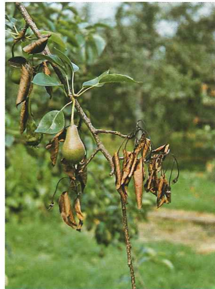
4) Nach Blüteninfektion abgestorbene Kuztriebe an Birne. Typisch sind die schwarz verfärbten, befallenen Pflanzenteile

Im Frühjahr und Sommer kann man mitunter feuchte zunächst farblose, später gelbbraun gefärbte, klebrige Tröpfchen (siehe Abb. 6) an den befallenen Trieben, Früchten und Unterlagen sehen. Dieser infektiöse Bakterien Schleim (Exsudat) wird besonders unter feucht-warmen Bedingungen reichlich produziert. Neben den Tröpfchen können auch fadenartige Strukturen auftreten, insbesondere bei Trockenheit. Sie sind vor allem bei der Ausbreitung durch Wind und Vögel von besonderer Bedeutung.